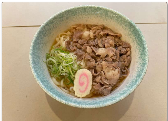
飛騨牛肉うどん (温) ¥1,150