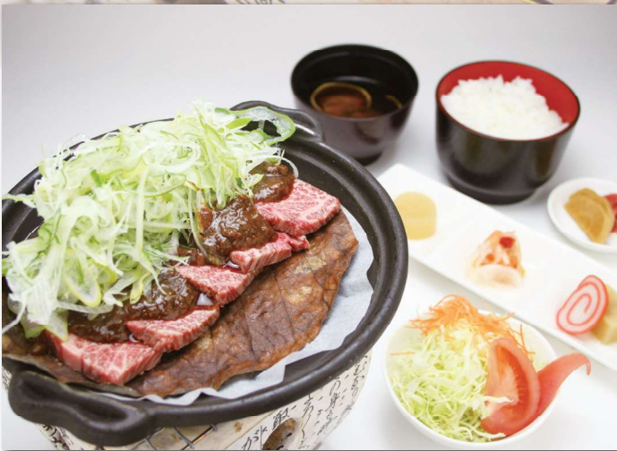
飛騨牛朴葉みそ焼肉御膳 約70g ¥2,100

高山市清見町は飛騨牛の産地です。 飛騨牛は、霜降りが多く、柔らかくとても 美味しいと好評です。 本場の飛騨牛をお楽しみください。