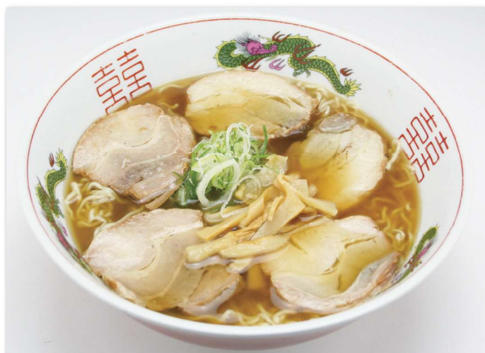
高山チャーシューメン