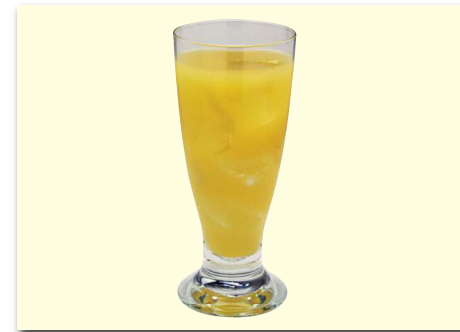
オレンジジュース ¥450