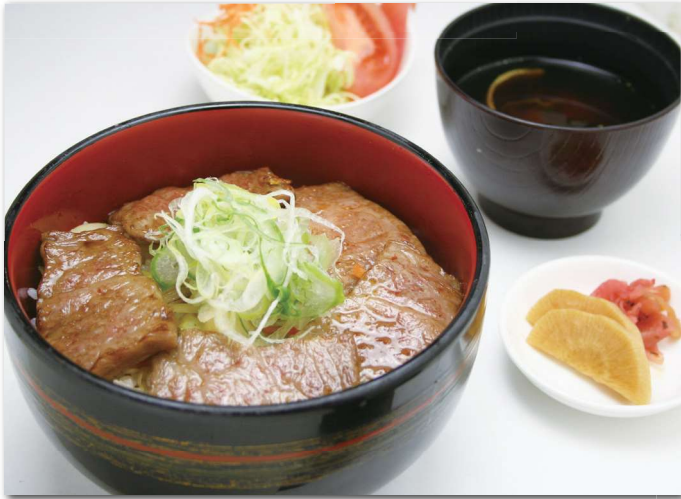
飛騨牛カルビ丼 約70g ¥1,800 サラダ/味噌汁/漬物付