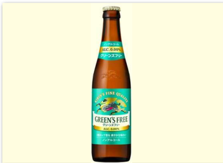
ノンアルコール ¥360 KIRIN