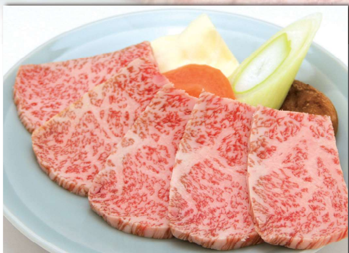
飛騨牛ロース肉 約100g ¥2,460