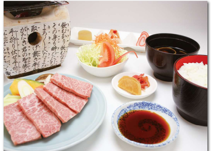
飛騨牛ロース御膳 約100g ¥2,800