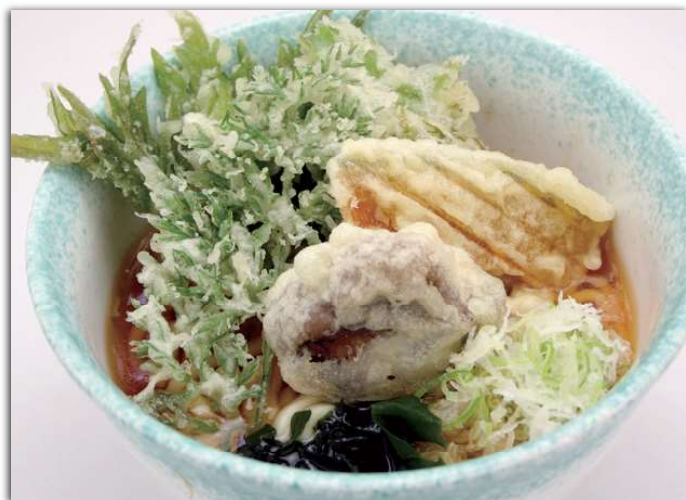
天ぷらうどん (温) ¥1,000