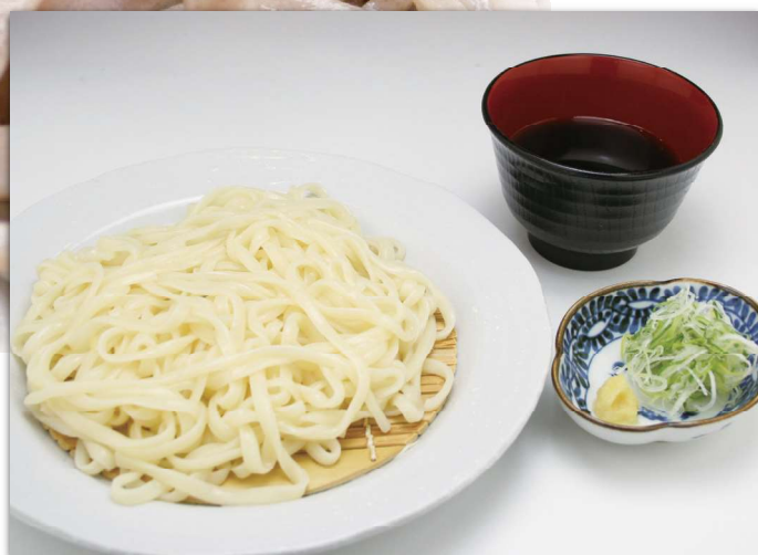
ざるうどん (冷) 天ぷら