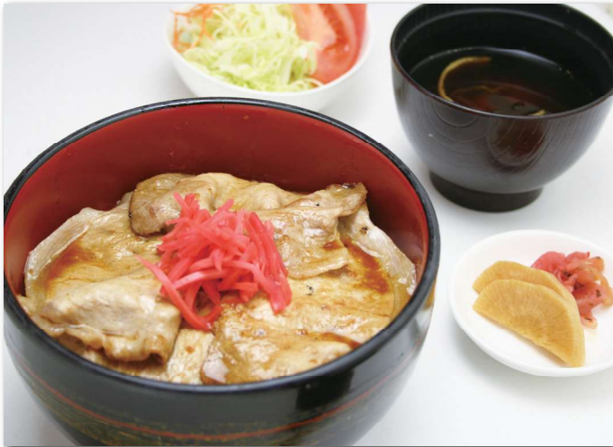
飛騨豚焼肉丼 ¥1,000 サラダ/味噌汁/漬物付