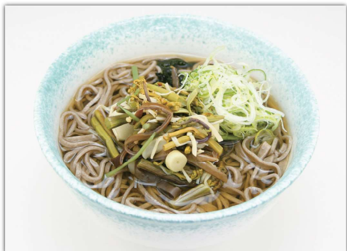
山菜そば (温) ¥750