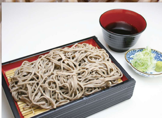
ざるそば(冷) 天ぷら