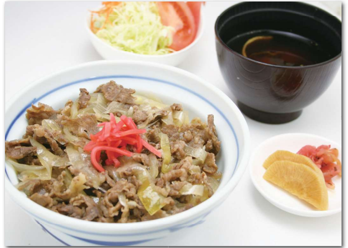
飛騨牛牛丼 ¥1,200 サラダ/味噌汁/漬物付