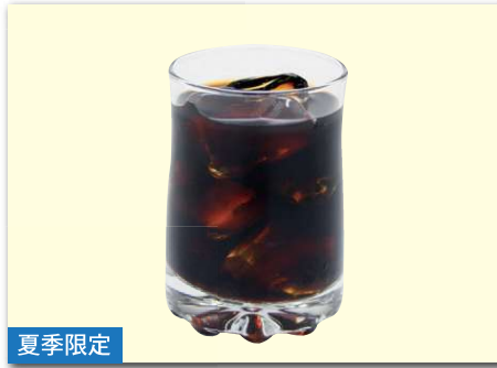
夏季限定 アイスコーヒー ¥450