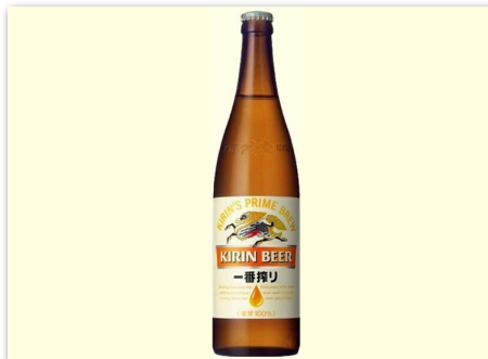
中瓶ビール ¥600 KIRIN