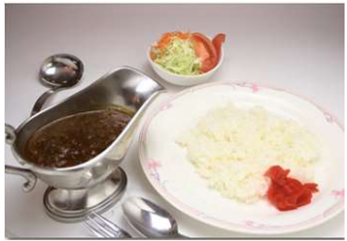
飛騨牛すじカレー ¥1,200 サラダ付