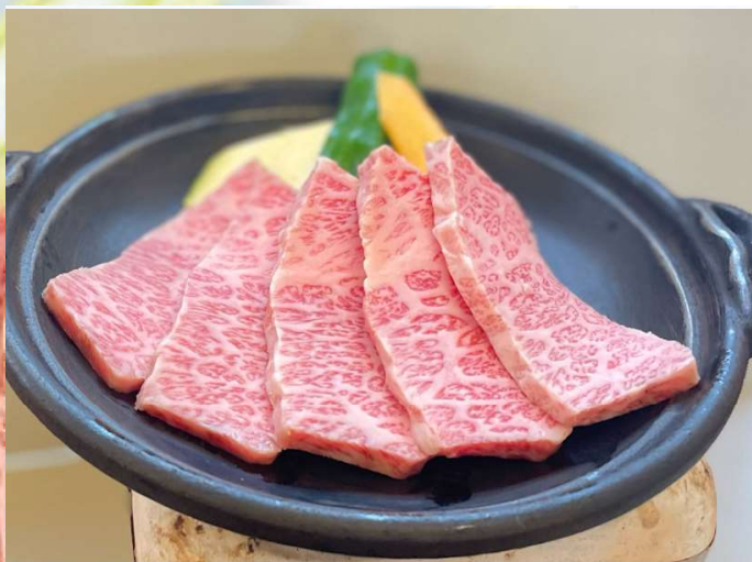
飛騨牛カルビ肉 約100g ¥2,200