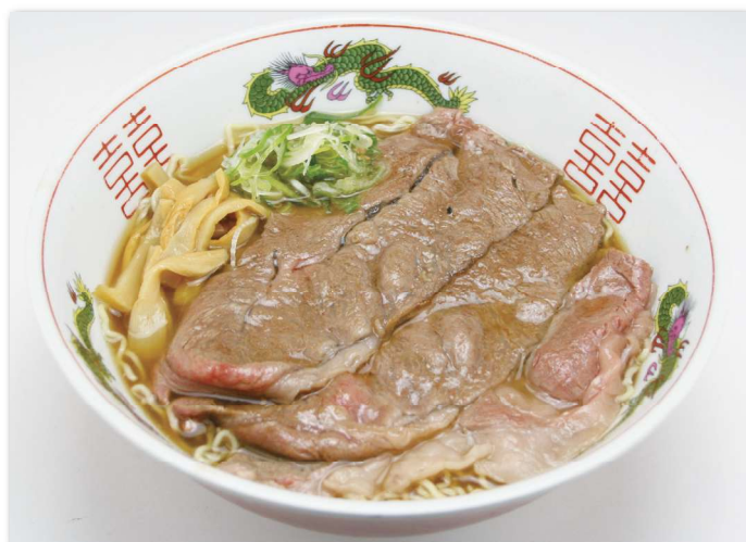
飛騨牛高山ラーメン