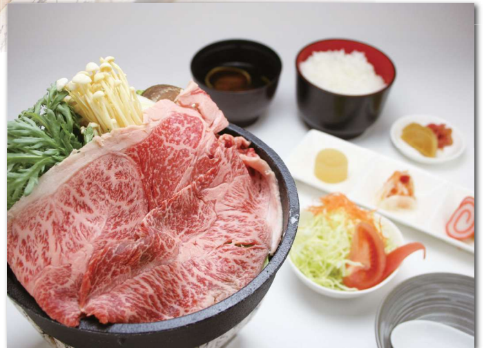
飛騨牛すき焼き御膳 約70g ¥2,100 (生たまご+¥80)

飛騨の名物「飛騨牛」と「ほう葉味噌」を一度に味わえます。 飛騨牛と自家製味噌が香り立つあつあつの陶板でお召し上がりください。 三菜（煮物、酢物、和え物）/サラダ/ご飯/味噌汁/漬物付 クルミ入り