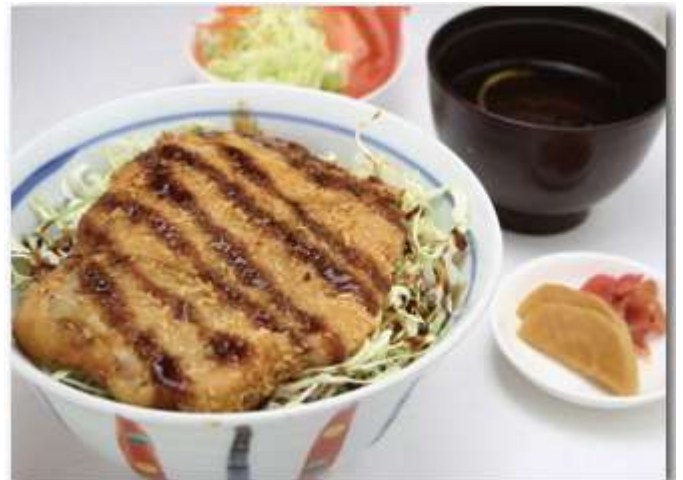
飛騨豚ソースカツ丼 ¥1,200 サラダ/味噌汁/漬物付