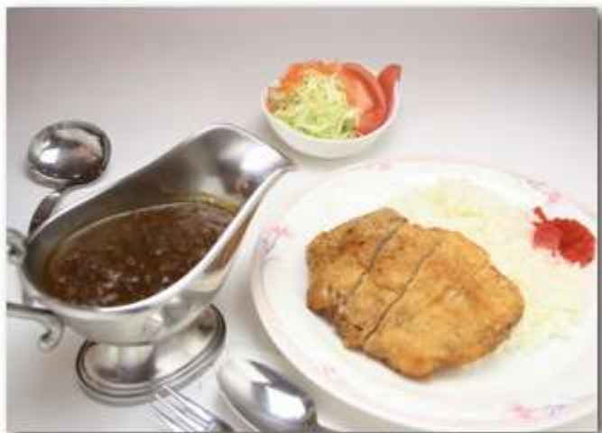
飛騨豚カツカレー ¥1,600 サラダ付 (飛騨牛すじ入り)