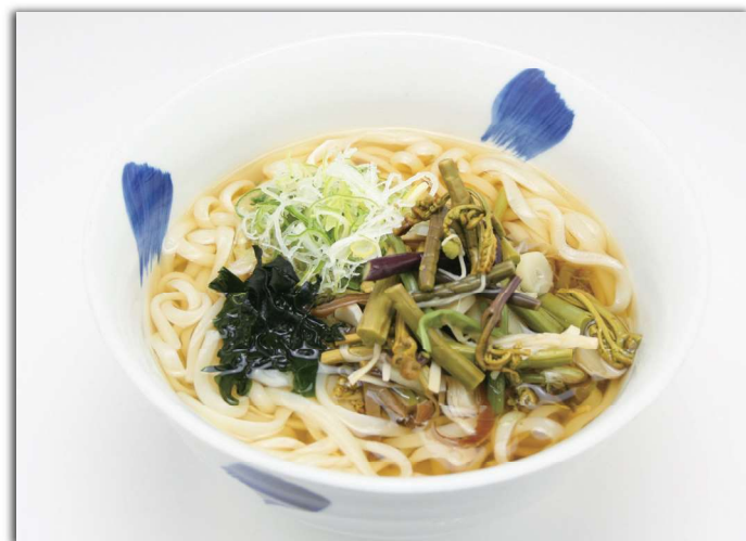
山菜うどん (温) ¥750