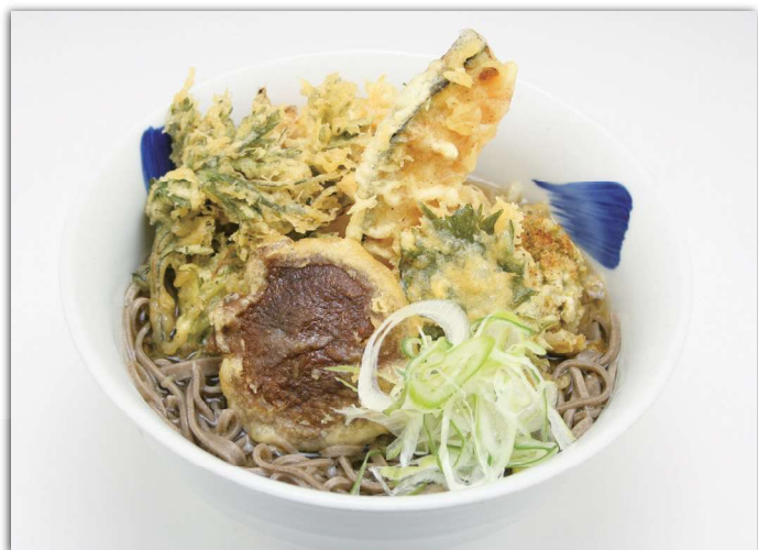
天ぷらそば (温) ¥1,000