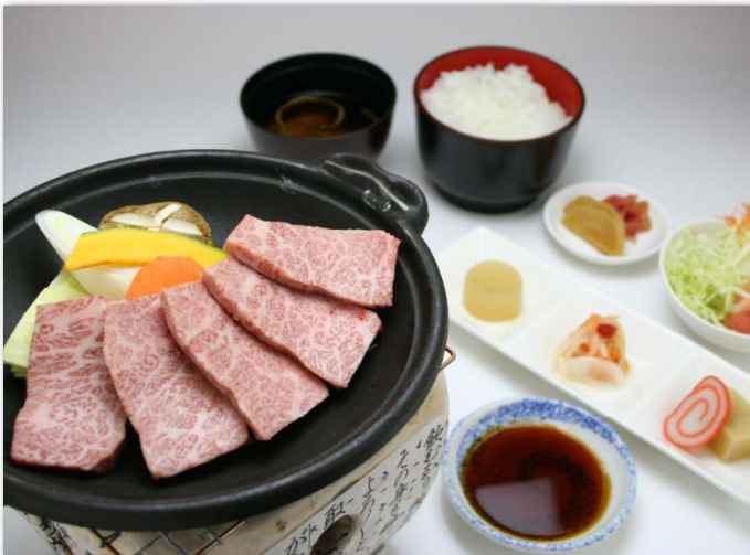
飛騨牛カルビ御膳 約100g ¥2,600